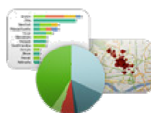
SIMPLE USER EXPERIENCE